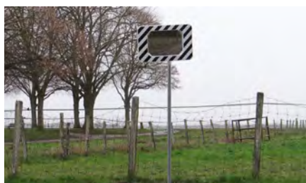
Rue de Flagy / Rue des Marais