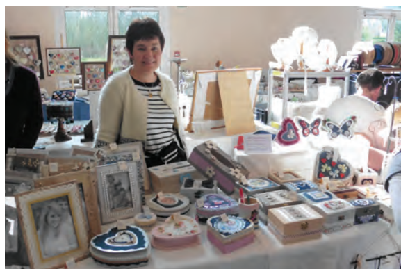
Stand tenu par une ferroteoise