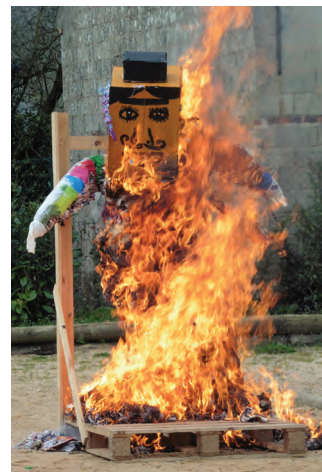
Monsieur Carnaval a été brûlé pour marquer la fin de l'hiver