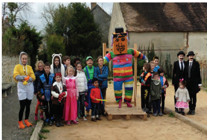
Monsieur Carnaval entouré de petits et de grands enfants déguisés