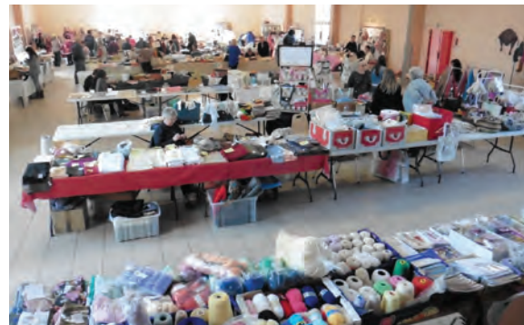
32 exposants pour l'édition 2017