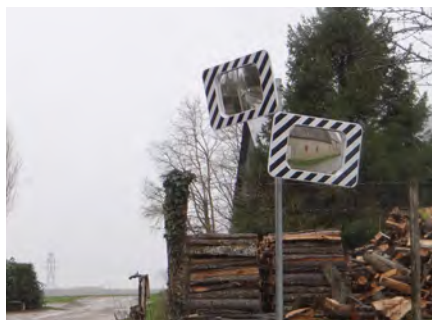
Rue de Flagy / Route de Bichereau

Ces réalisations ont été possibles grâce à l'obtention d'une subvention du Conseil départemental de Seine-et-Marne sur la répartition des amendes de polices.