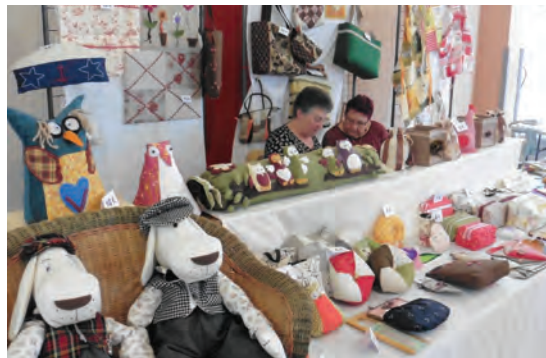
Stand des Petites mains de Thoury