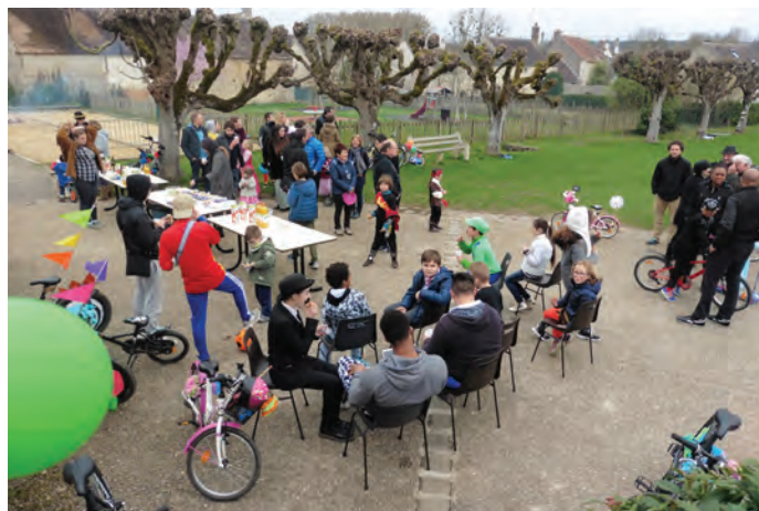
Le beau temps a permis de goûter en plein air sur la place de la mairie

" Nous avons confectionné Monsieur Carnaval avec une combinaison contre l'amiante, que nous avons remplie de papier journal. Il nous a fallu plusieurs séances pour construire la structure qui le maintient, créer et peindre le personnage mesurant plus de 2 mètres... le tout dans une bonne ambiance ! Comme le veut la tradition marquant la fin de l'hiver, il a été brûlé et a disparu en seulement quelques minutes... Ensuite, nous avons servi boissons, bonbons et goûter à tous les participants. Merci à tous ! "