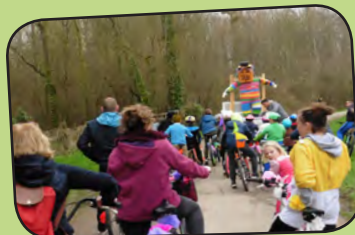
pages 8-9 Le carnaval à vélo