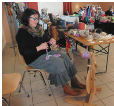
Tissage de laine au rouet

Financièrement, " Les petites mains de Thoury " se portent bien. L'ambiance des séances de travail, dans un local municipal rue de Flagy, est très conviviale et cosy. Ce qui n'empêche pas la douzaine d'adhérentes d'être consciencieuses et de produire pour elles et pour l'association des pièces uniques destinées à trouver acquéreurs lors de différentes manifestations.