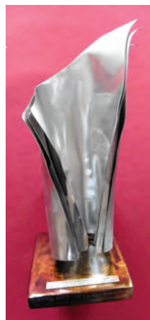
Le trophée signé François Lavrat.