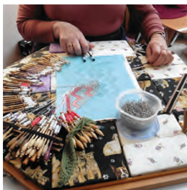
Confection de dentelles