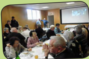
page 14 Cérémonie de la galette