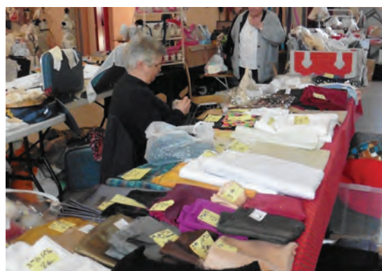
Des tissus par centaines