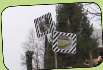
page 2 Sécurité routière