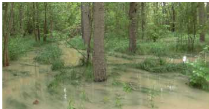
▲ Le bois de Bichereau

Les pompiers et la SAUR, très sollicités par les communes plus durement touchées que la nôtre, comme Moret-sur-Loing et Nemours, n'ont pu intervenir immédiatement auprès des particuliers et des équipements communaux. La solidarité et le recours au système D ont permis de limiter les dégâts.