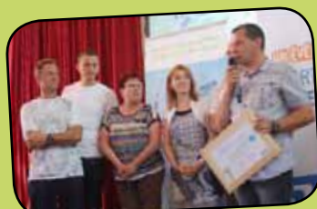
page 8 Trophée zéro phyt'eau