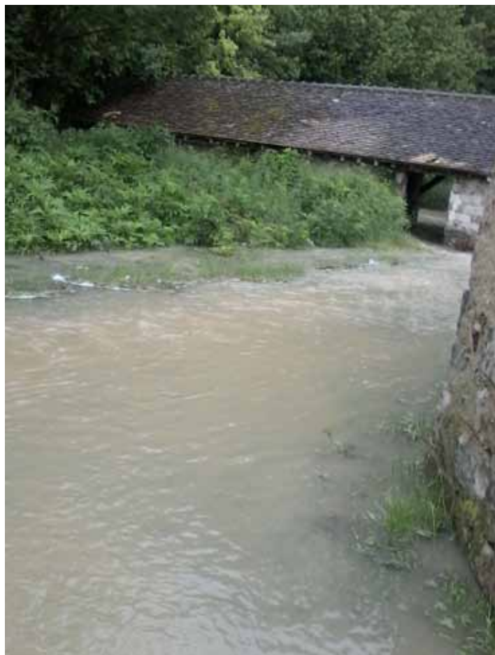
▲ Le lavoir rue du Lavoir. Ne pas s'y méprendre, ce n'est pas l'Orvanne...