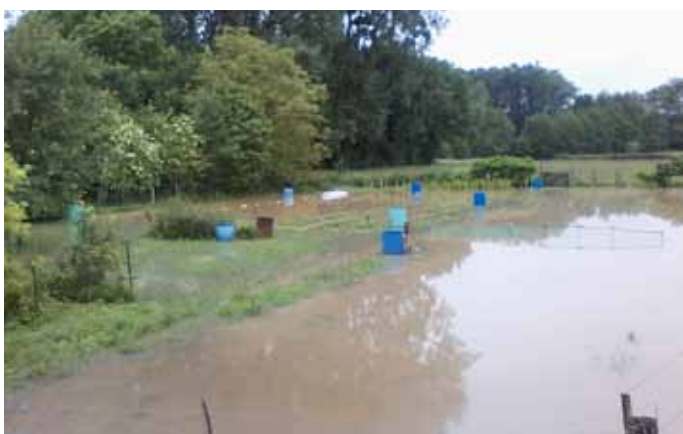
▲ Les jardins potagers rue de Verdun