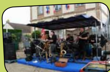
page 10 Fête de la musique