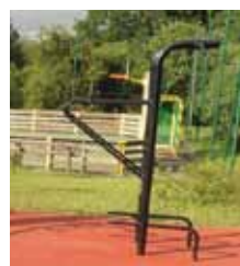
Tractions (street workout)