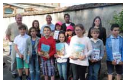
Les enfants de CM1 et CM2 domiciliés à Thoury

Pour les plus grands, pas de spectacle mais une remise d'ouvrages aux élèves par les maires des communes du RPI. Les CM1 ont reçu un livre sur "les plus beaux récits du monde" et les CM2 un dictionnaire pour le collège.