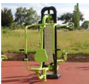
Push-pull (muscles haut du corps)