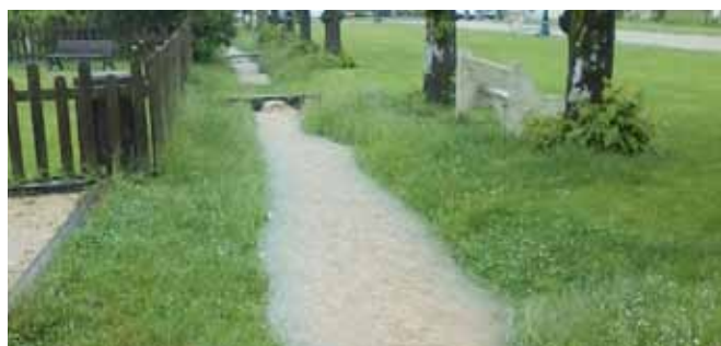
▲ Le griffon place de la mairie a pris l'allure d'un ruisseau