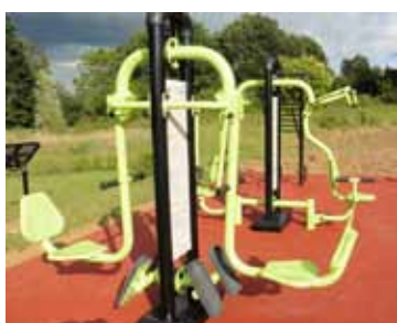
Squat machine (muscles jambes)