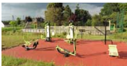
Espace fitness à Thoury-Ferrottes