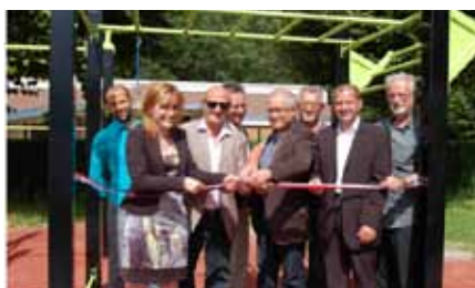
Inauguration du street workout de Voulx

Thoury-Ferrottes fait partie des 3 communes de la CCBG à bénéficier de l'installation d'équipements sportifs. Financés par la CCBG et le Département de Seine-et-Marne, six agrès fitness ont été installés à côté du City-Stade situé en haut de la rue de Verdun, tandis que Noisy-Rudignon et Voulx dispose d'un "street workout" (entraînement de rue).