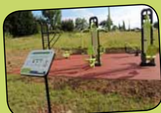
page 3 Équipements sportifs