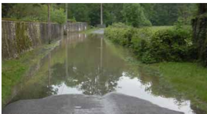
▲ La rue de la gare avant le pont des Marais