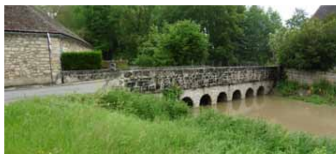
▲ L'Orvanne sous le pont d'arc rue de Verdun