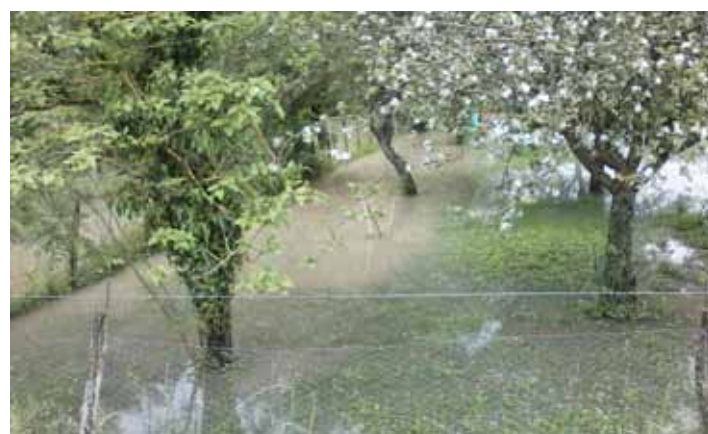
▲ Un verger les pieds dans l'eau