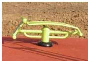
Banc à abdos (muscles bassin)