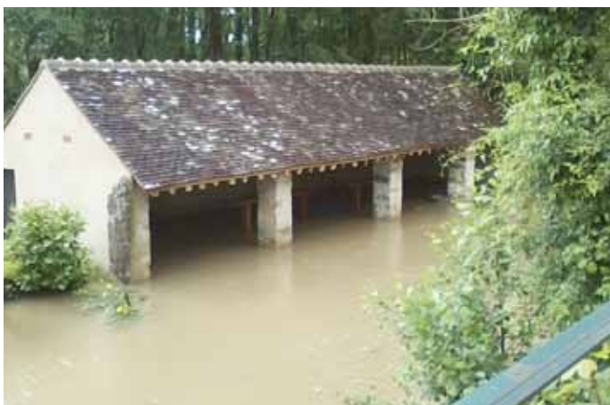
▲ Le lavoir de Bichereau récemment rénové