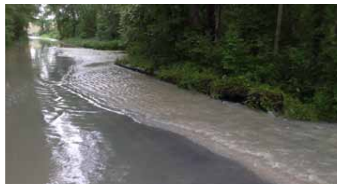
▲ La rue de Bichereau