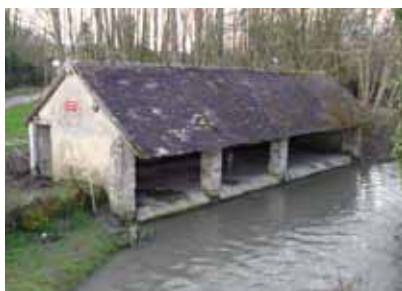
▲ Avant les travaux

Les travaux de réfection du lavoir ont commencé début mars 2015 et se sont achevés fin juillet 2015.