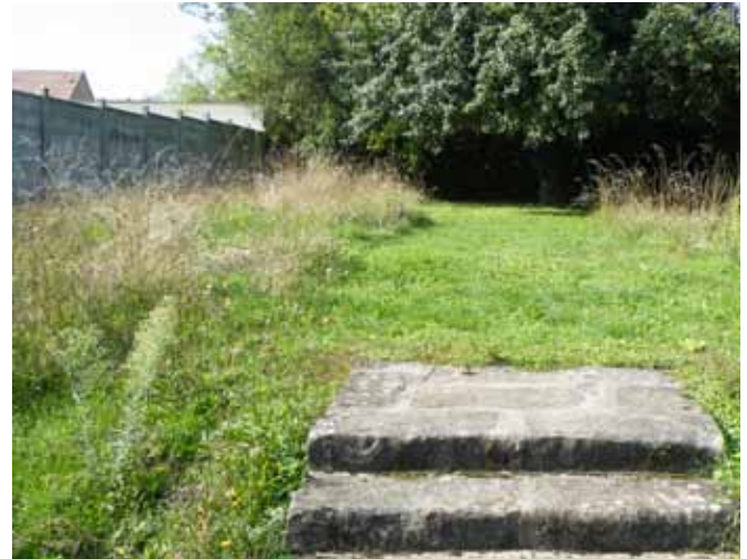
▲ Rue de Flagy : Zone de biodiversité