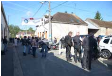
▲ Rassemblement et exposition des motos à Bichereau

Si vous souhaitez participer, donner un petit coup de main avant pendant ou après, ou tout simplement voir apparaître votre logo ou publicité sur nos flyers et affiches, contactez le 06 19 52 03 38 ou repas.feerique@gmail.com .