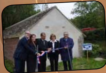
p. 8-11 L'inauguration du lavoir de Bichereau