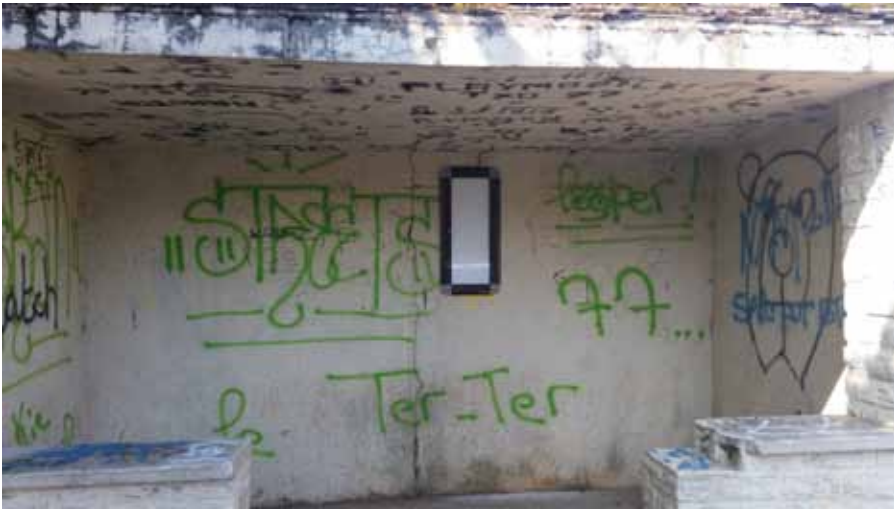
▲ Avant : un abri insalubre

Espérons que le travail des jeunes sera respecté pour que cet abribus arbore le plus longtemps possible son teint blanc !