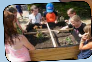
p. 22 : l'apprentissage du jardinage à l'école

GROS SUCCÈS POUR LA FÊTE DE LA POMME 2015 !