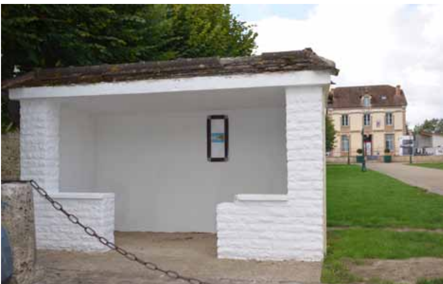
▲ Après la rénovation