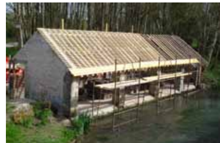
▲ Pendant les travaux