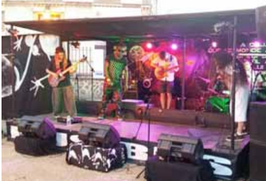
▲ Le groupe Natural Respect

Beaucoup de personnes présentes furent ravies de ce week-end, autant pour l'ambiance que pour la qualité des artistes proposés par La Curieuse. Ce qui pousse l'association à vous amener dans l'avenir, à faire plein de belles découvertes, en vous espérant toujours et encore plus curieux.