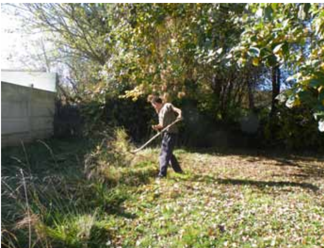
▲ Rue de Flagy : Fauchage à l'ancienne...