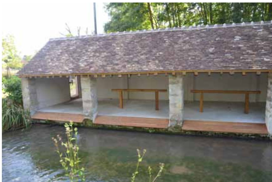
▲ Après les travaux