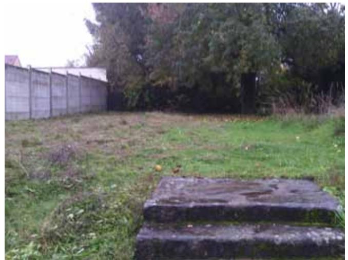
▲ Rue de Flagy : Après la fauche annuelle en octobre