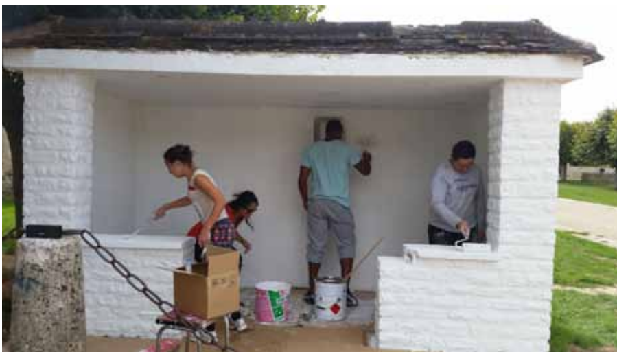
▲ Les jeunes en action