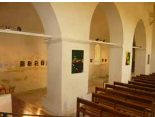
▲ L'église de Thoury-Ferrottes, lieu d'accueil de l'exposition LE BATOFAR.