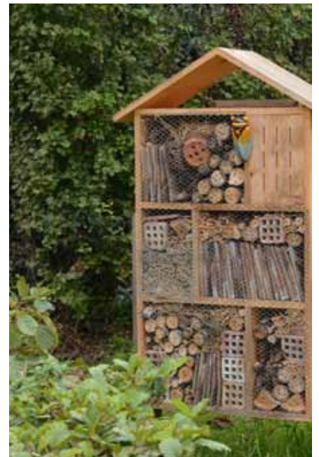
▲ Un hôtel à insectes à été implanté près du lavoir de Bichereau, un deuxième dans la cour de l'école. Ces "logements" sont des refuges pour des petites bêtes...