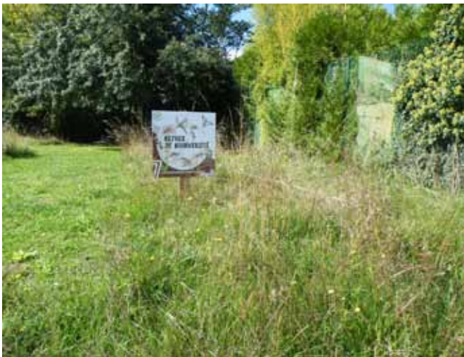
▲ Rue de Flagy : Zone de biodiversité

Consulter le site Internet : www.gestiondifferentiee.org