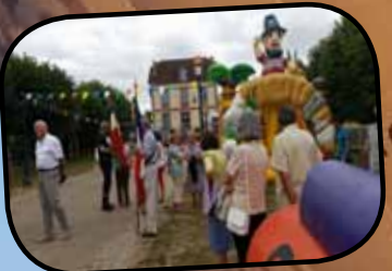
p. 14 La fête nationale en photos