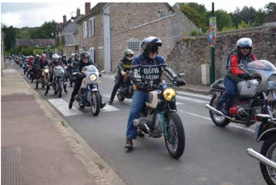
▲ Défilé des motos le dimanche midi pour une balade dans la région.