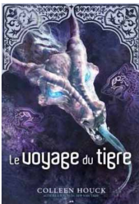
Les cinq tomes de la série de Colleen Houck ◀

Il ne faut pas s'arrêter au nombre de pages, il faut s'accrocher au début et ensuite on ne peut plus s'en défaire. Cette écrivaine me passionne. "