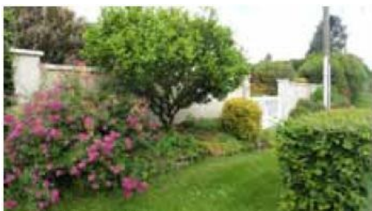
Jardin de M. Gadot

Le 26 novembre 2016, des membres du conseil municipal accompagnés de trois concourants au concours des maisons fleuries de notre village se sont rendus à la remise des prix officiels organisé par le département de Seine-et-Marne.